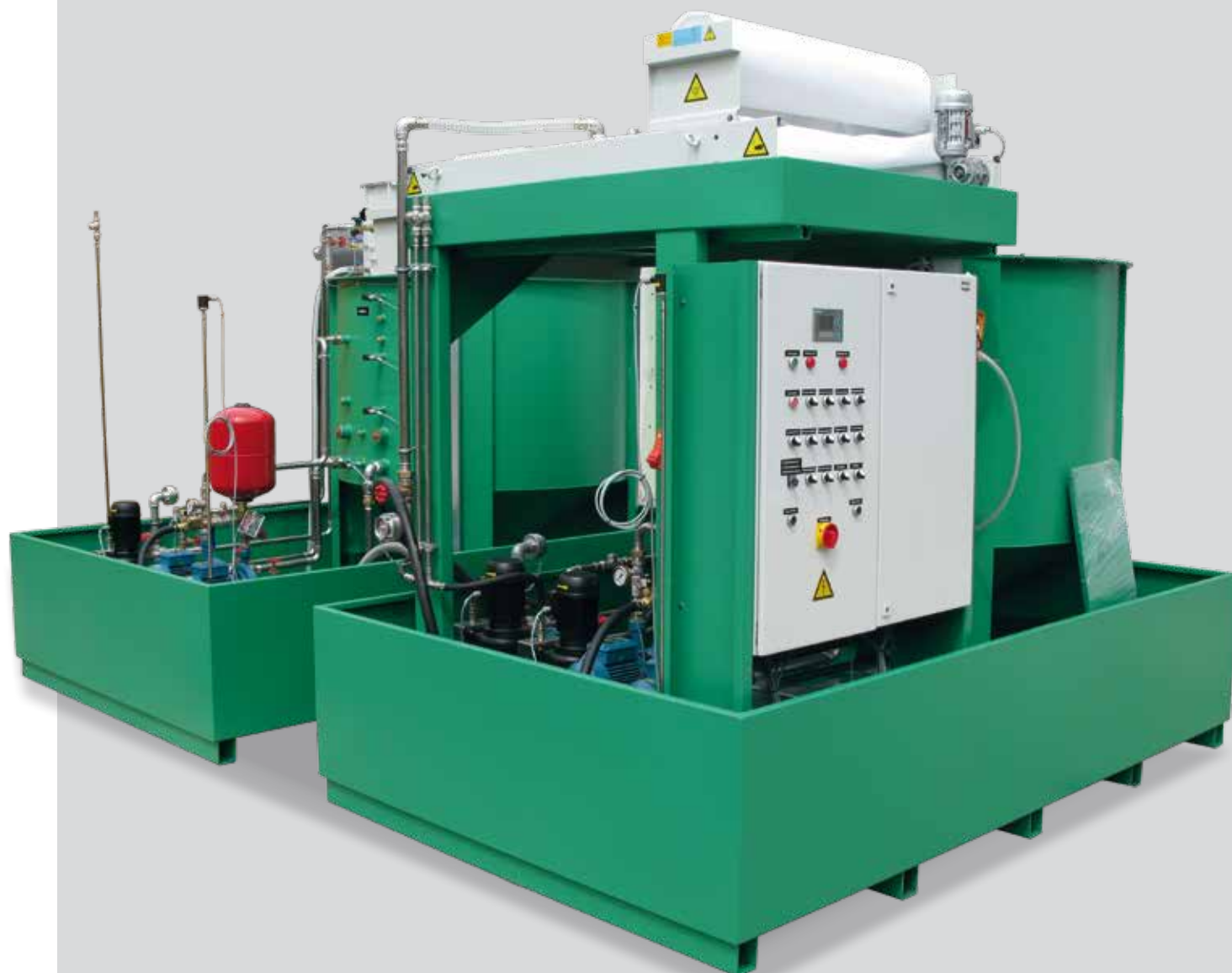
Aufbereitungsanlage für KSS (kundenspezifisch)