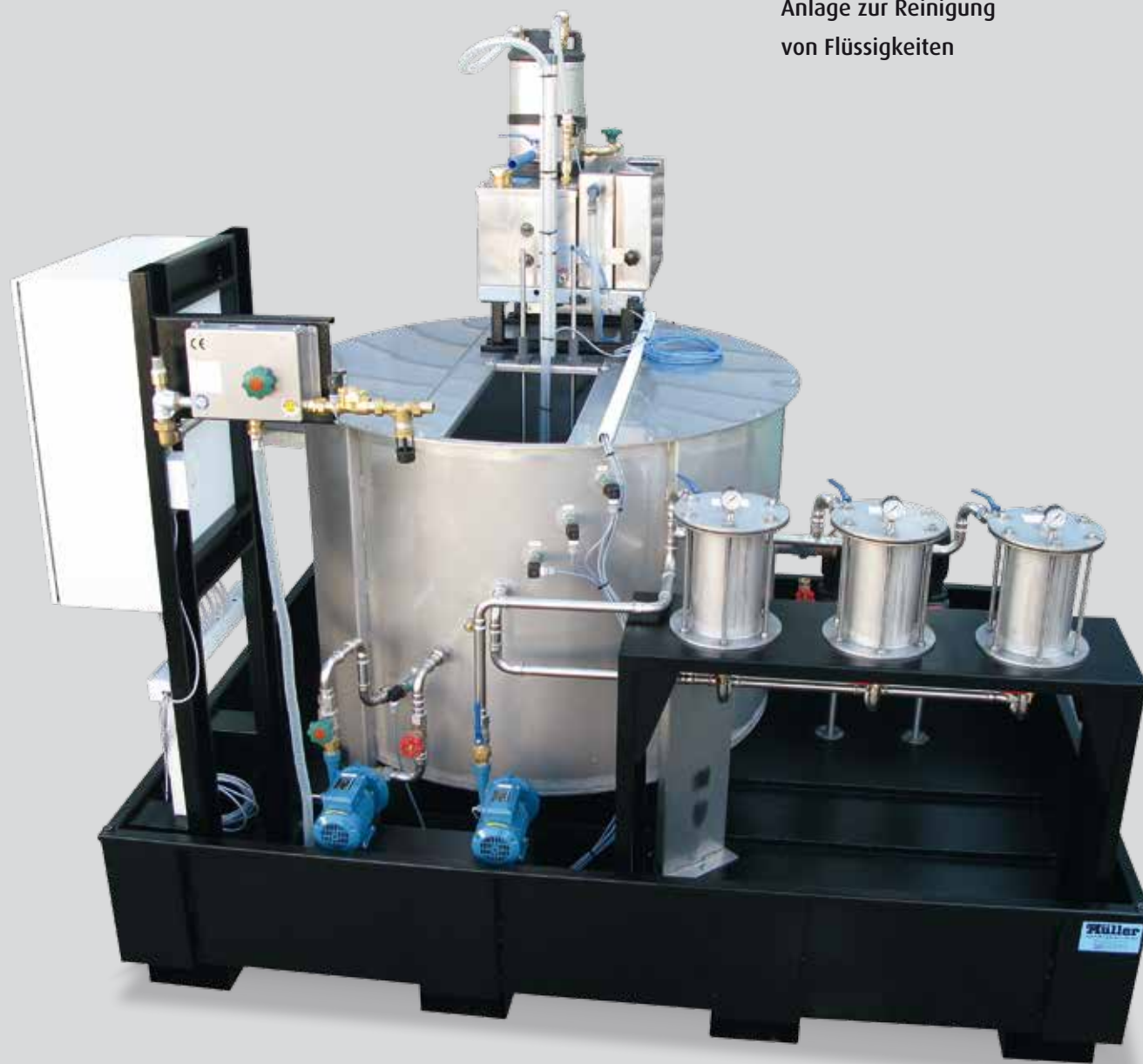
Anlage zur Reinigung von Flüssigkeiten