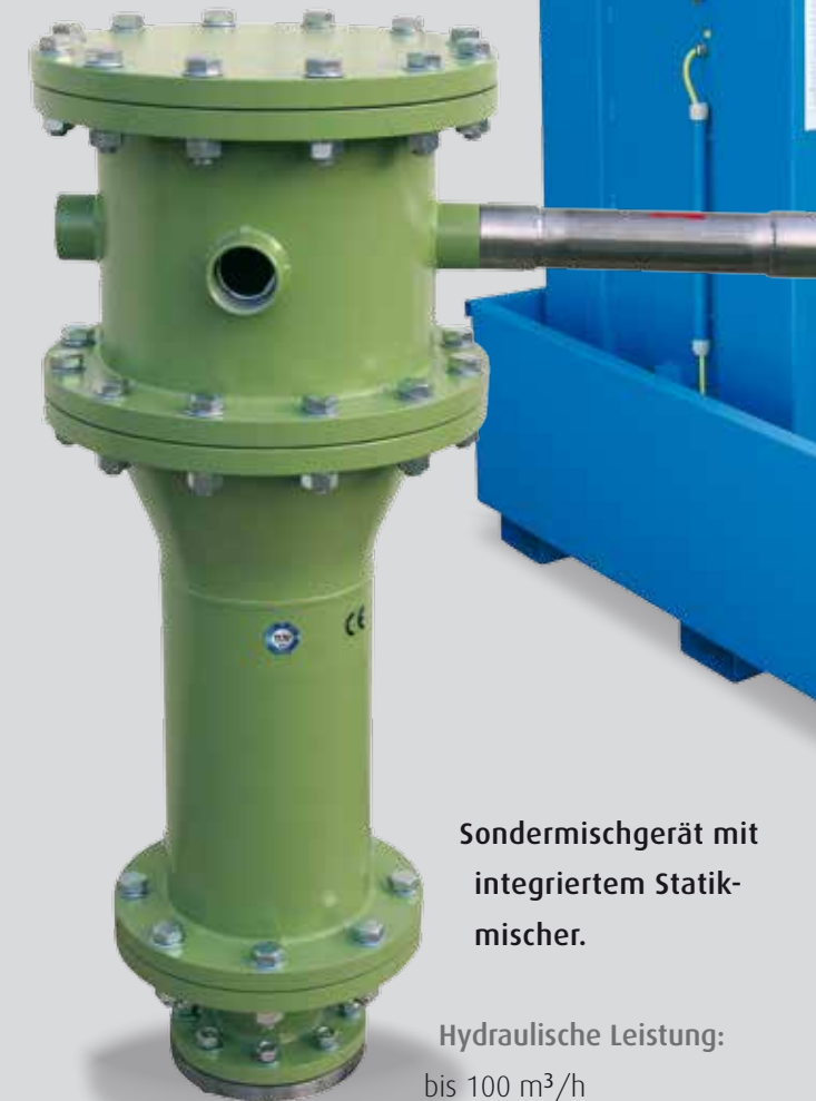
Sondermischgerät mit integriertem Statikmischer.