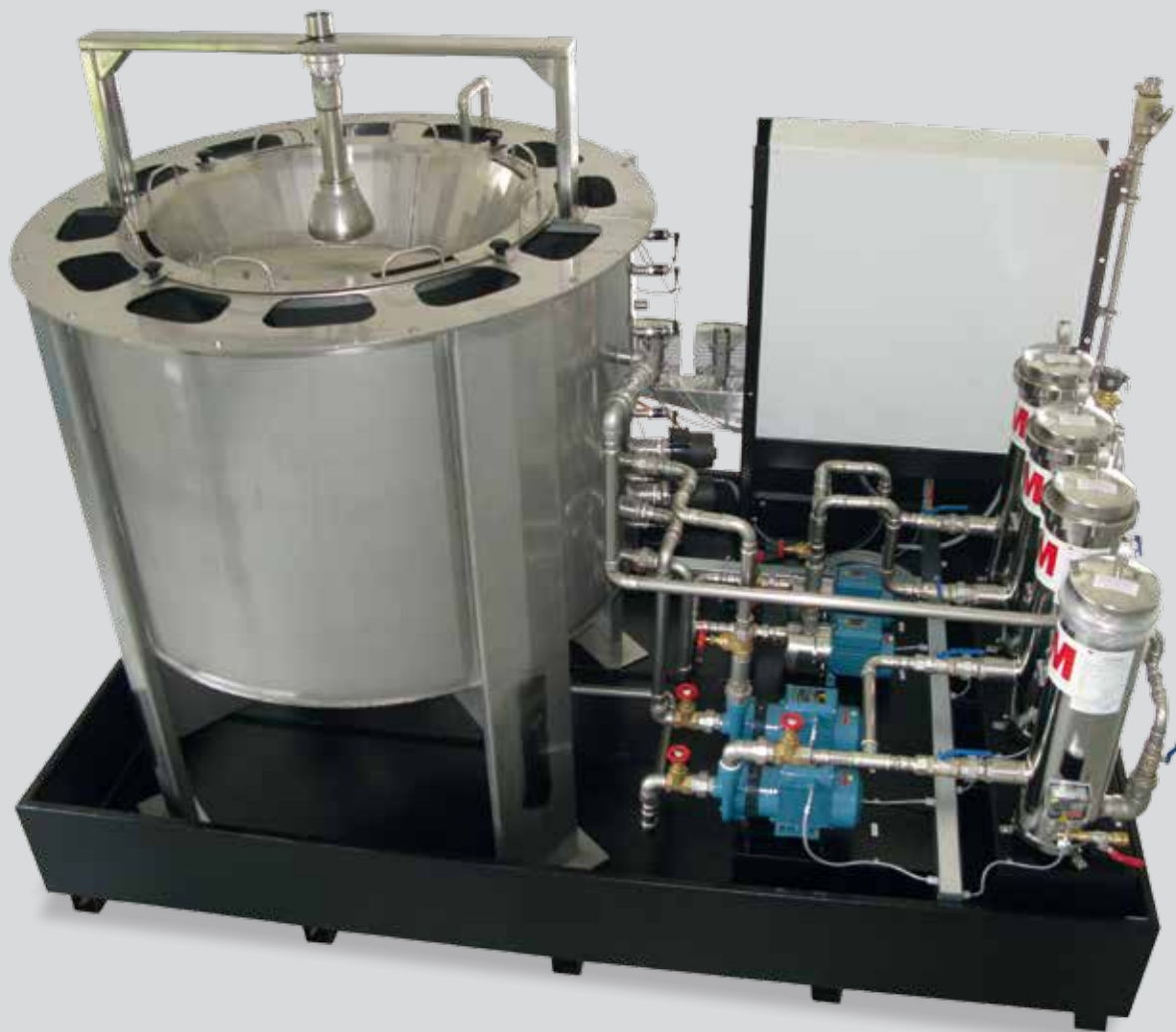
Aufbereitungsanlage für KSS (kundenspezifisch)