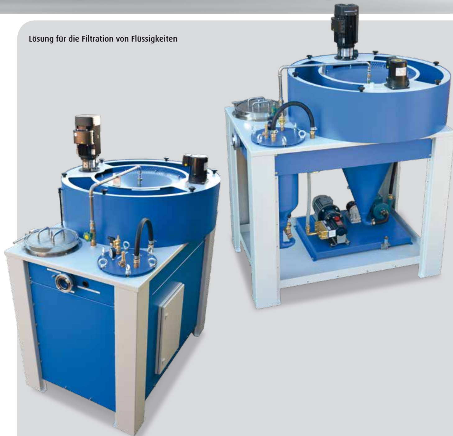
Lösung für die Filtration von Flüssigkeiten