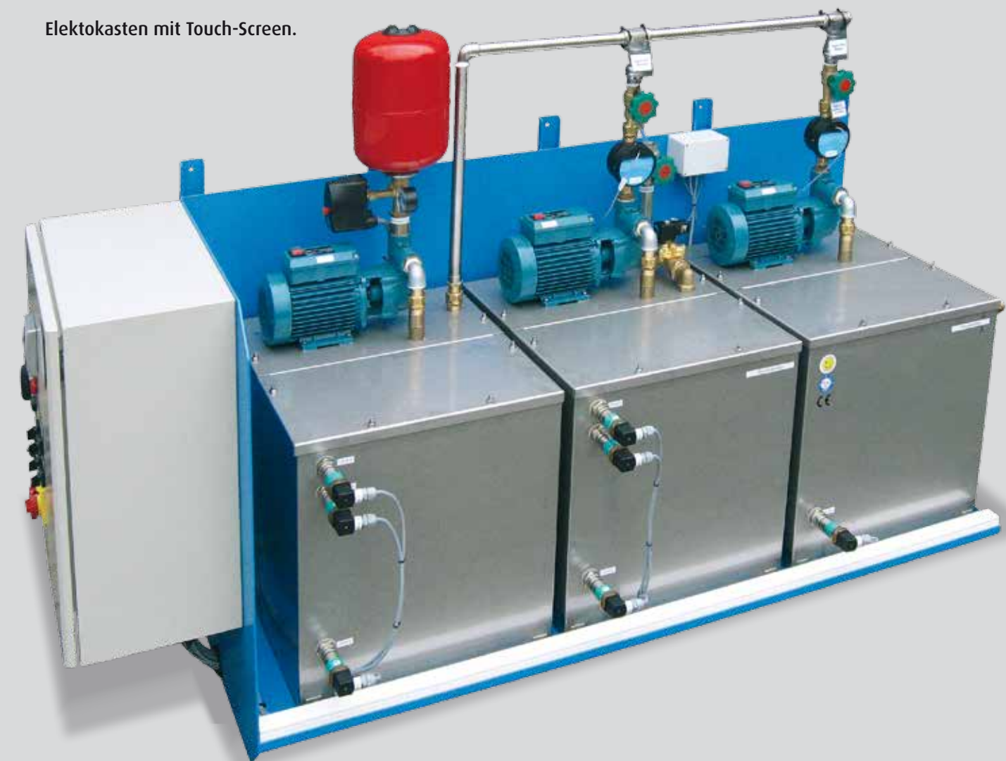
Elektrokasten mit Touch-Screen.