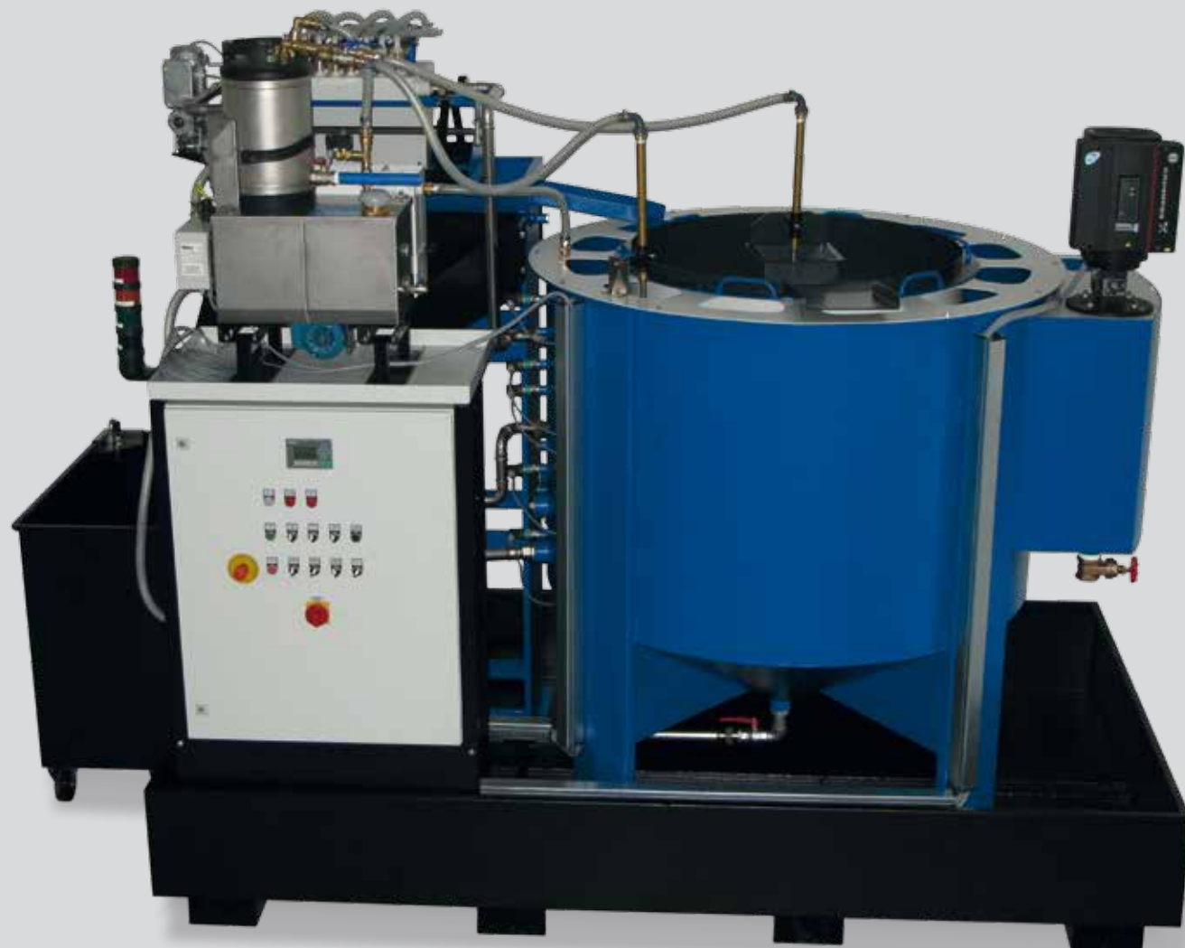
Heli Blue Motion 8 – Zyklonfiltereinheit mit automatischem Schmutzaustrag (kundenspezifisch)