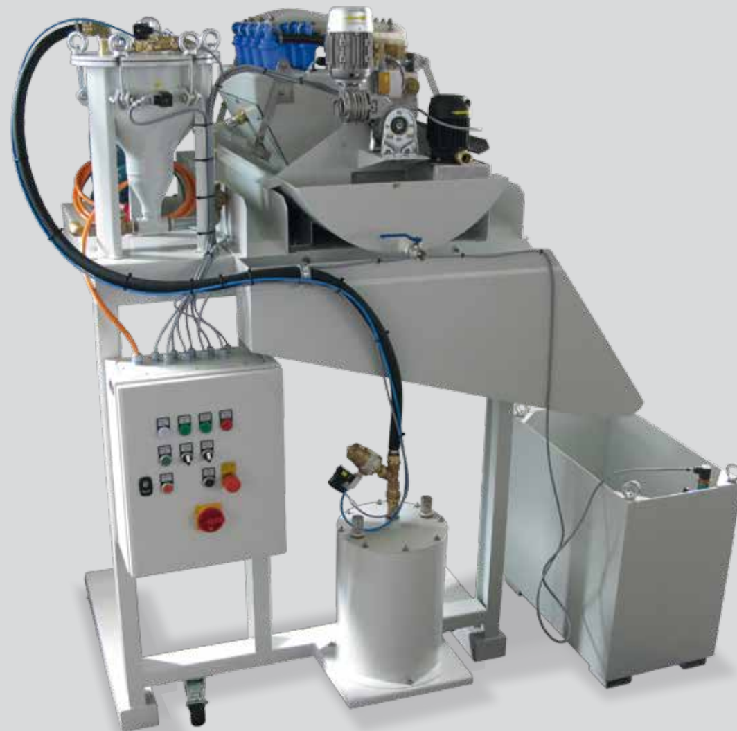
Heli Blue Motion 8 – Zyklonfiltereinheit mit automatischem Schmutzaustrag