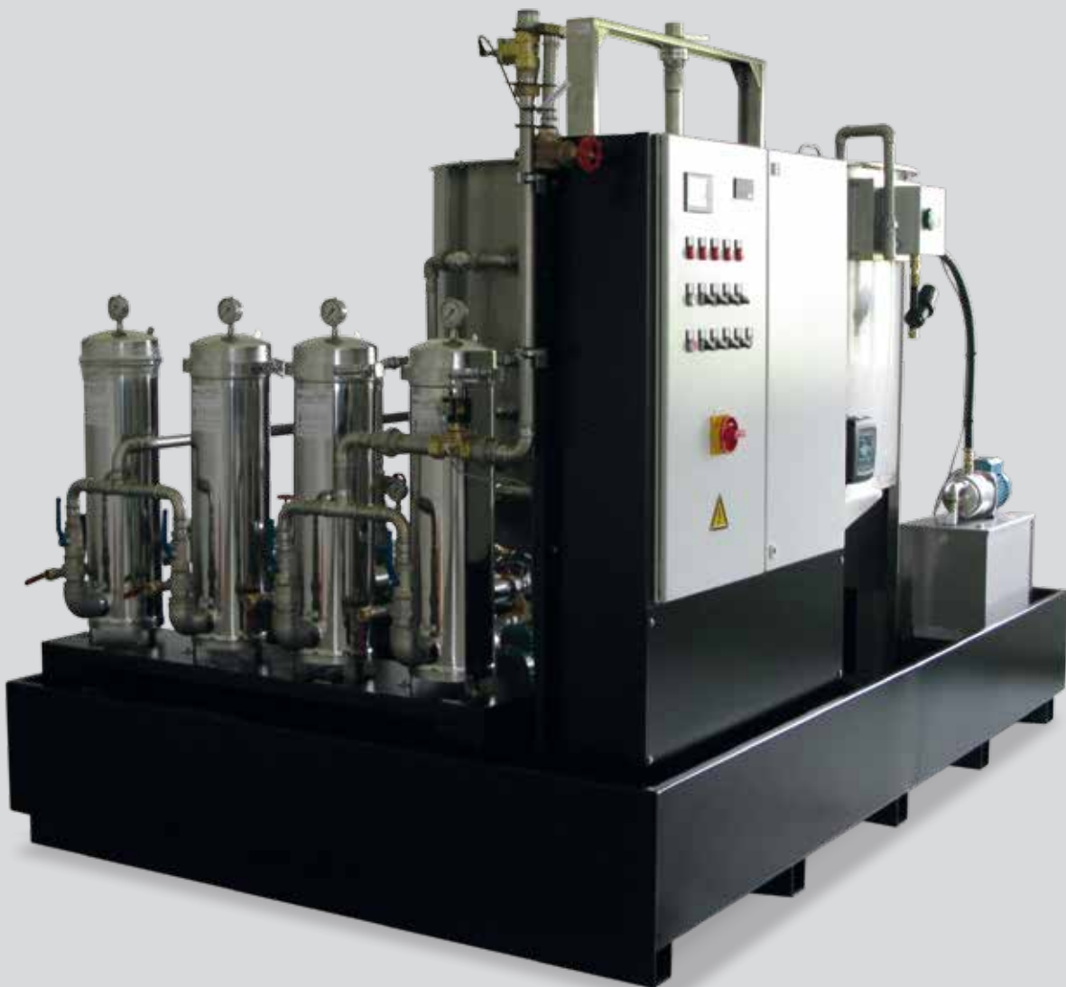
Aufbereitungsanlage für KSS (kundenspezifisch)