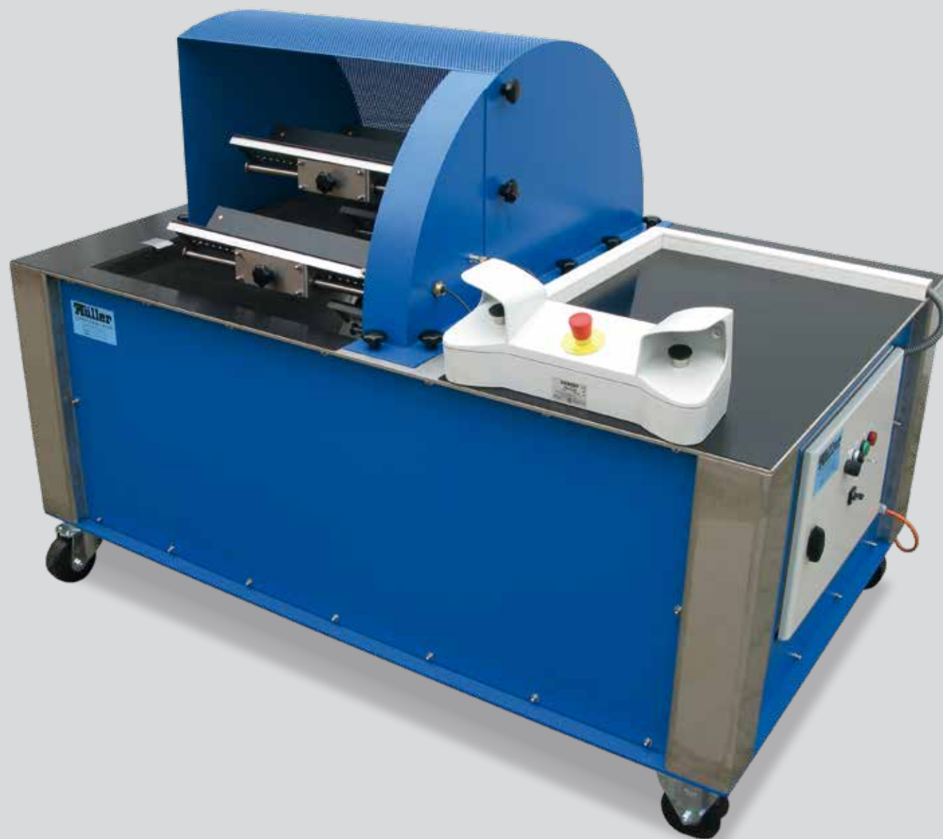
Rotationstauchbecken für Korrosionsschutz