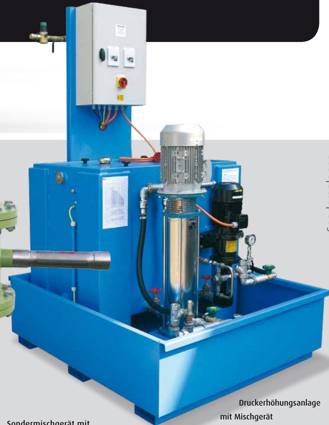
Druckerhöhungsanlage mit Mischgerät Mini digital 3000.